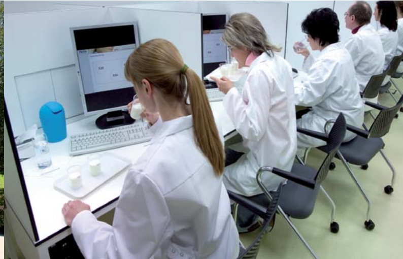
Einzelprüfung im modernen Sensorikraum der muva kempten

stitution ihrer Art und unterrichtet in 8 Sprachen in Solingen (und bei Veranstaltungen auf allen Kontinenten).