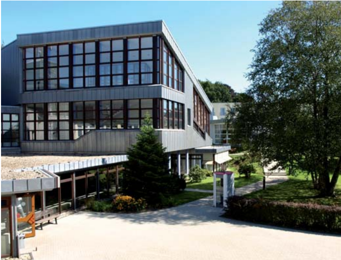
Der große Hörsaal der ZDS Solingen